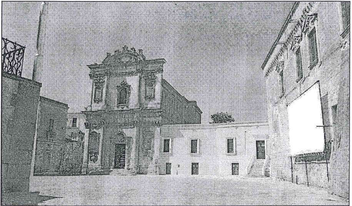
Mesagne, Piazza Orsini del Balzo e la Chiesa di S. Anna.

vano e facevano segni di saluto. Quando fummo tra le case, gruppi di persone lungo la strada lastricata, vedendoci sfilare silenziosi e ordinati, se pure sotto il peso degli zaini e delle armi, timidamente applaudivano. "Italiani, Italiani" gridavano i bambini e ci seguivano correndo. Altri si avvicinavano per chiederci da dove venivamo e dove eravamo diretti per chiederci notizie di loro congiunti.