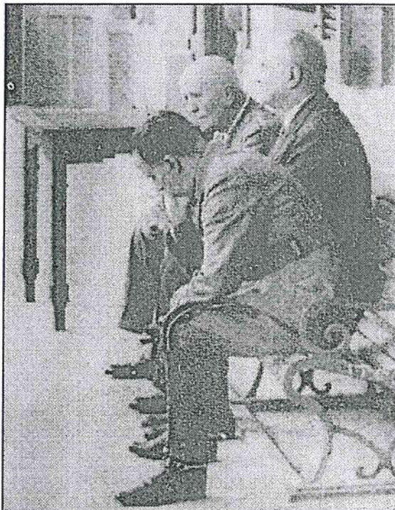
Badoglio a Brindisi.

Il giorno 10 settembre del 1943, alle ore 14,00, il re arrivò a Brindisi a bordo della corvetta "Baionetta" proveniente da Ortona a Mare-Pescara. Sull'unità della Regia Marina, oltre ai reali, vi era anche ciò che rimaneva di un governo ormai a brandelli: due ministri, un commissario e ben 57 generali, e su questo dato sarebbe opportuno porre delle riflessioni: tanto si è scritto e condannato in merito alla fuga dei reali, ma poco si è detto in merito alla codardia dei vertici militari i quali lasciarono le truppe allo sbando e pensarono solo di poter mettere in salvo la propria pelle. Come non ricordare, a tal proposito, le poche righe con le quali Indro Montanelli e Mario Cervi hanno fissato l'evento della partenza dalla costa abruzzese del corteo reale? Scrissero: "Gli eletti furono in tutto 57, agli altri che rimasero a terra imprecaando e mostrando i pugni - alcuni nella foga di squagliarsela erano saliti su una draga priva di equipaggio, che ovviamente non si mosse - fu promesso che sarebbe arrivata una seconda unità, a raccogliarli. La promessa, stranamente, fu mantenuta alle sette del mattino, allorchè un'altra nave da guerra entrò nel porto. Ma i